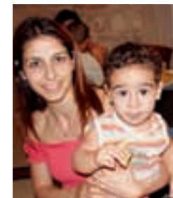
Flüchtlinge in Abrahams... 18