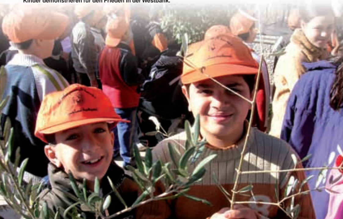
Kinder demonstrieren für den Frieden in der Westbank.

keine Gehaltszahlungen an Mitarbeiter der öffentlichen Verwaltung in den palästinensischen Gebieten mehr gezahlt werden konnten. Darunter leiden viele Familien sehr.