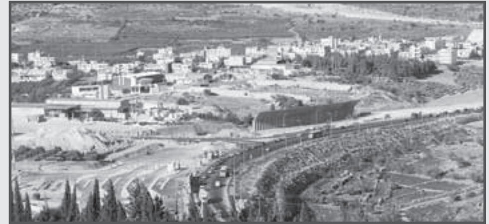
... im September 2006 ...