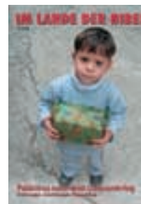
Zum Titelbild: Der kleine Junge aus Beit Sahour hofft und freut sich auf den Weihnachtsmann.

In herzlicher Verbundenheit und mit besten Grüßen zum Weihnachtsfest, Ihre Almut Nothnagle