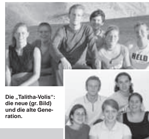
Die „Talitha-Vols“: die neue (gr. Bild) und die alte Generation.