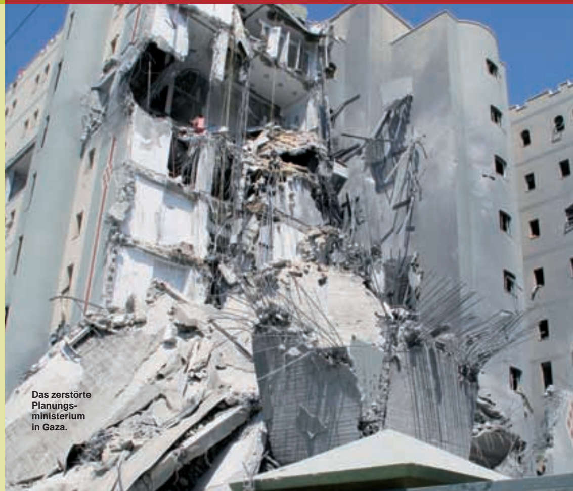
Das zerstörte Planungsministerium in Gaza.