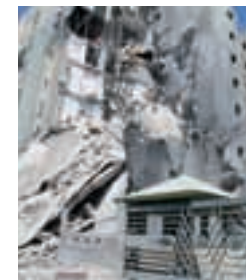
Nach dem Libanonkrieg, ab 7