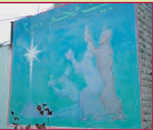
Die Hoffnungen der Jahrtausendwende, blass, aber noch immer sichtbar .

Es gibt ihn – mit Augen zu sehen und mit Füßen zu betreten. In der Tradition der Kirche ist es die schmale Straße von Bethlehem über Beit Sahour