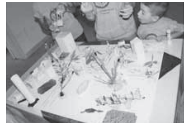
Beim gemeinsamen Basteln entsteht eine Traumstadt – mit Teichen und Swimmingpools.

in Ramallah. Wie in den Tagen vorher, in denen die Situation in Gaza verfolgt wurde, hörten wir die Nachrichten und sahen die Bilder aus Beirut auf BBC oder CNN. Ashraf, der in Bei-