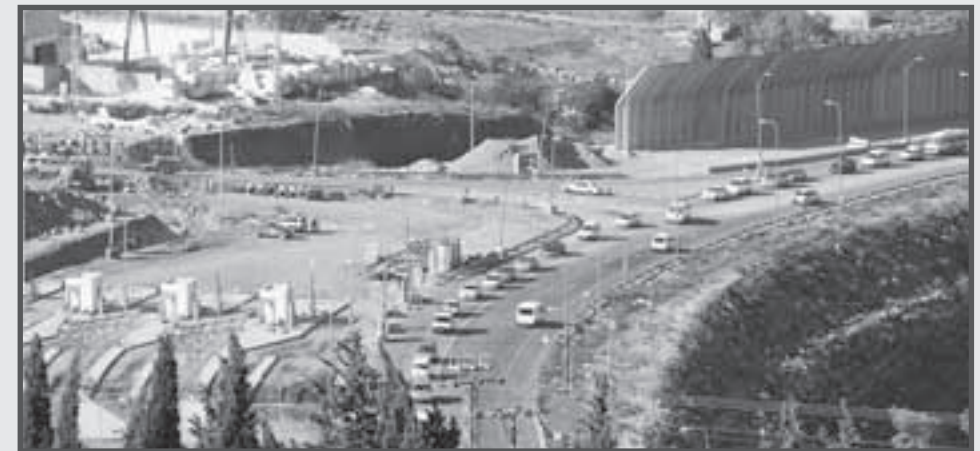
... und nur einen Monat später, im Oktober 2006: die Checkpoint-Häuschen sind fast fertig.

Angefangen hat es mit der Rodung von Bäumen, dann folgten Erdarbeiten, und schließlich war die Entwicklung eines mehrspurig angelegten Checkpoints zu erkennen. In der Zwischenzeit sind die Häuschen und die sich anschließenden Überdachungen dieses Check-