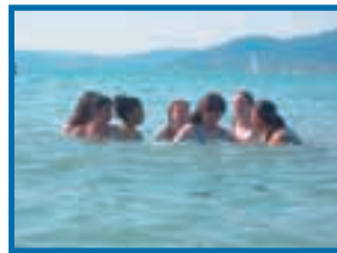
Die Schülergruppen in Stuttgart, Talitha Kumi und im Bodensee.