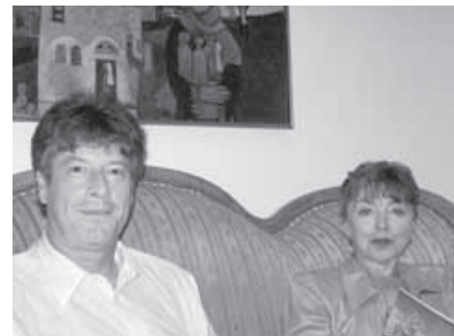
Abschied und Neubeginn im Nahostreferat.

referat der Landeskirche mit dem Berliner Missionswerk verbunden wurde, wechselte sie in das Sekretariat des Propstes des Konsistoriums der EKBO.