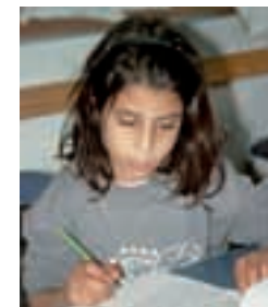
Hier können Sie helfen 46