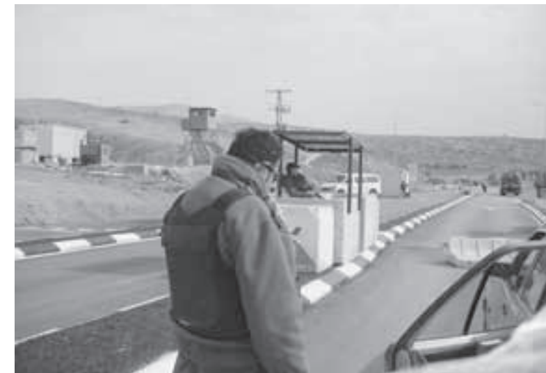
Eine typische Situation im Arbeitsalltag eines Wehrpflichtigen am Checkpoint.

Kippur-Krieg 1973. Mein Traum war, Pilot zu werden. Es war klar, dass ich diesen Traum verwirklichen und zur Sicherheit unseres Landes beitragen würde. Im Geschichtsunterricht lernten wir nichts über die Besatzung. Ich lernte diese schönen Friedens- und Trauerlieder kennen. Ich erfuhr von