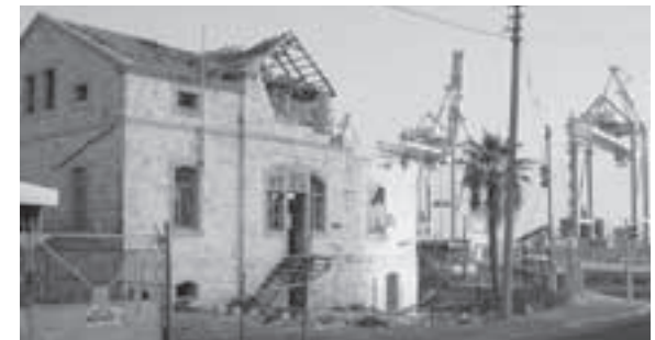
Das liebevoll restaurierte Struvehaus in Haifa – ein Opfer des Kriegs.