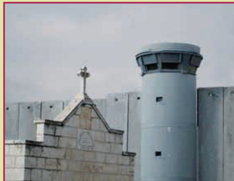
Die Geburtsstätte Jesu – eingemauert.

Heute stünden die drei Weisen aus dem Morgenland vor verschlossenen Türen.