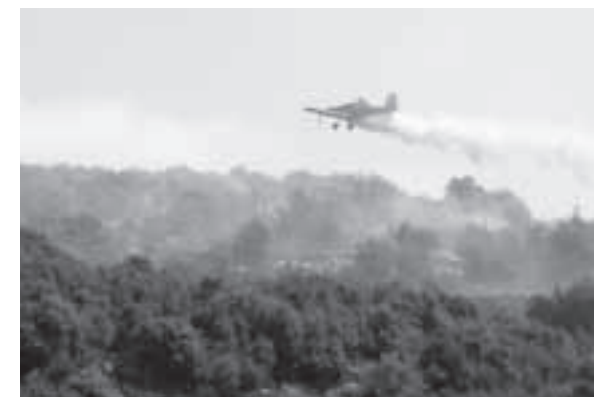
Löscharbeiten in den Bergen Nordgaliläas.

Nach dem Aufenthalt in Talitha Kumi sind wir innerhalb von drei Tagen nach der Waffenruhe heimgefahren.