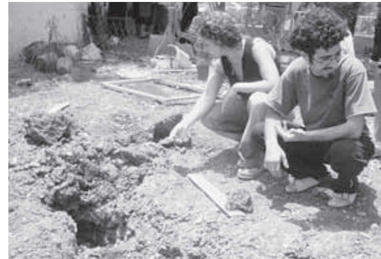
Raketeneinschläge im Hof der Hilfsorganisation St. George.

lischen Kirche. In den folgenden Tagen wurden immer mehr Häuser beschädigt. Nach mehreren Telefonaten mit meiner Familie habe ich – unterstützt durch meine Pfälzer Freunde – die Menschen nach Talitha Kumi schicken können. So brachen innerhalb von zwei Tagen ca. vierzig Personen nach Beit Jala auf.“