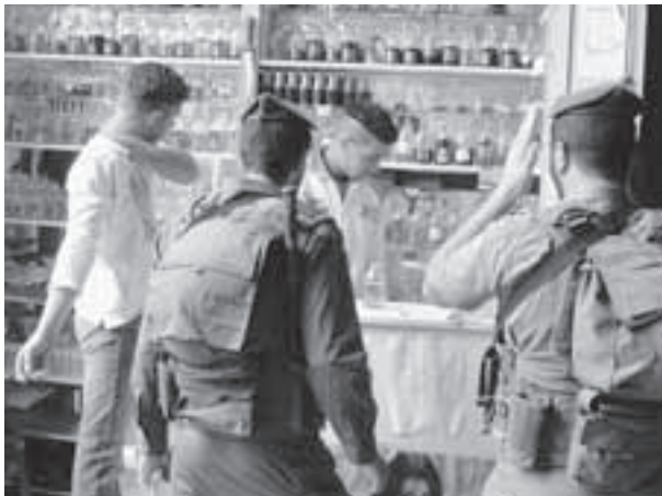
Soldaten in einer Bar.

wunderbaren Werten, von Demokratie, Frieden, Gerechtigkeit, Gleichheit und Freiheit. Ich brauchte viele Jahre, um herauszufinden, dass zur selben Zeit, während ich im Klassenzimmer saß und diese wunderbaren Werte vermittelt bekam, meine Regierung palästinensisches Land besetzte und seine Bewohner unterdrückte, die ohne diese wunderbaren Werte leben mussten. Wir haben eine so genannte Demokratie für Juden und die Palästinenser, die innerhalb der Grenzen von 1967 leben. Aber in den besetzten Gebieten herrscht völlige Apartheid.