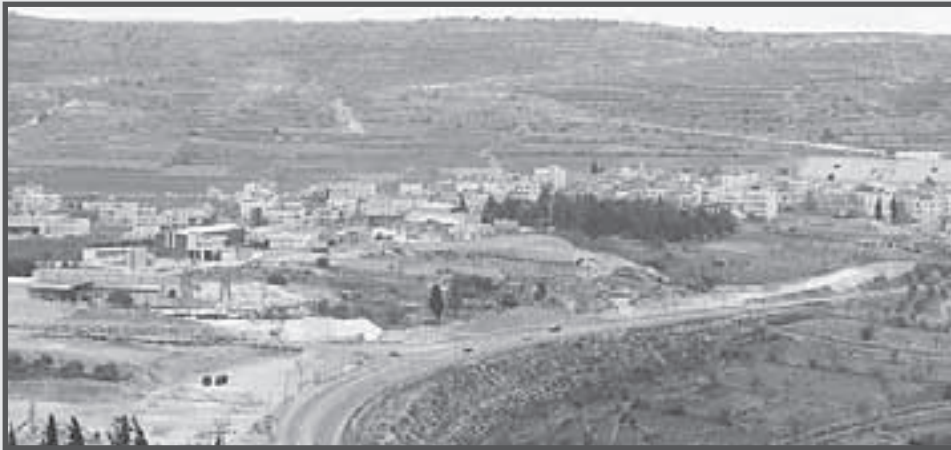
Blick von Talitha Kumi auf die Abzweigung nach Beit Jala im April 2006 ...

Seit nunmehr einem Jahr entwickelt sich der Sicherheitszaun bzw. die Mauer im Bereich der Abzweigung von der Straße 60 nach Beit Jala zu Talitha Kumi.