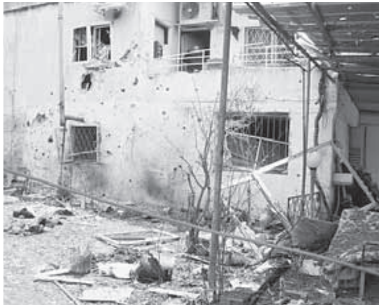
Das beschädigte Haus vom Onkel der Familie in Pekiin.

und das Verlassen der Schutzräume war auf eigene Gefahr möglich. Aber wir, die Christen (israelische Araber), haben weder private noch öffentliche Schutzräume. Nur Neubauten, die seit 1992 errichtet werden, verfügen über Schutzräume. Die erste Woche haben ca. 25 Personen bei meiner Schwester im Keller geschlafen. Diese Situation war nicht mehr haltbar. Die Raketen fielen täglich im Wald oberhalb unseres Dorfes, auf den Straßen und auf den Felder nieder. Das Haus meines Onkels war in den ersten Tagen getroffen worden, kurz darauf das Haus meiner Nichte und im Hof der katho-