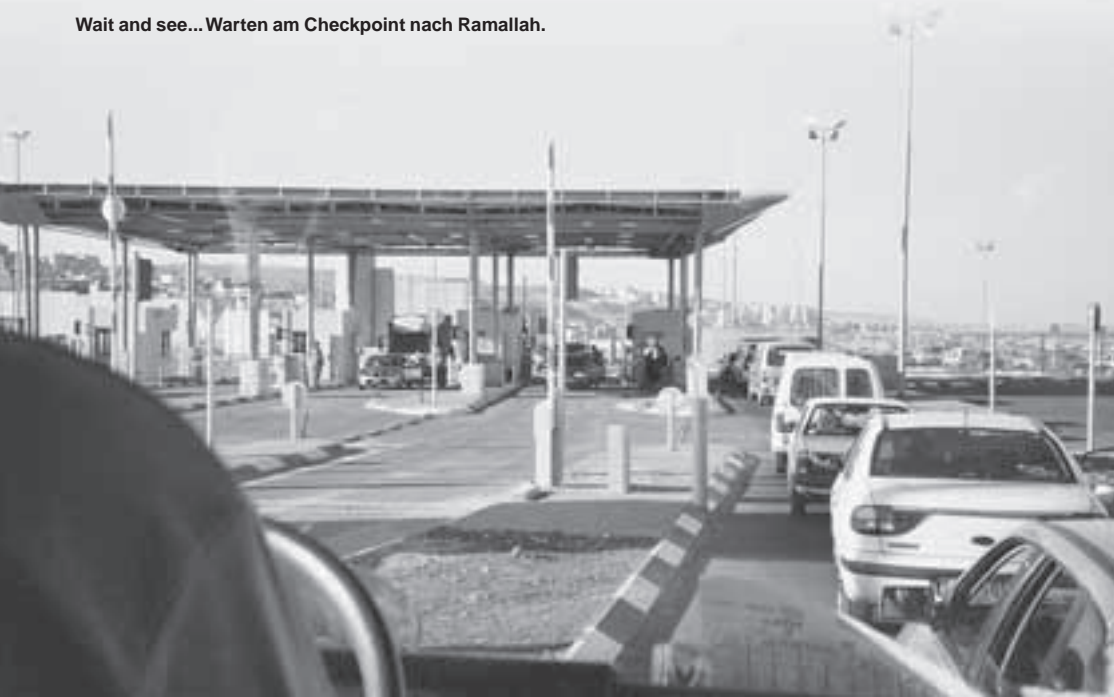
Wait and see... Warten am Checkpoint nach Ramallah.

nen Stadt herausführt. Der Halt an den Checkpoints, die Passkontrolle, der prüfende Blick des jungen Soldaten durch den Bus – durch die Grenzerfahrungen im damaligen geteilten Berlin seltsam vertraut und doch ganz anders.