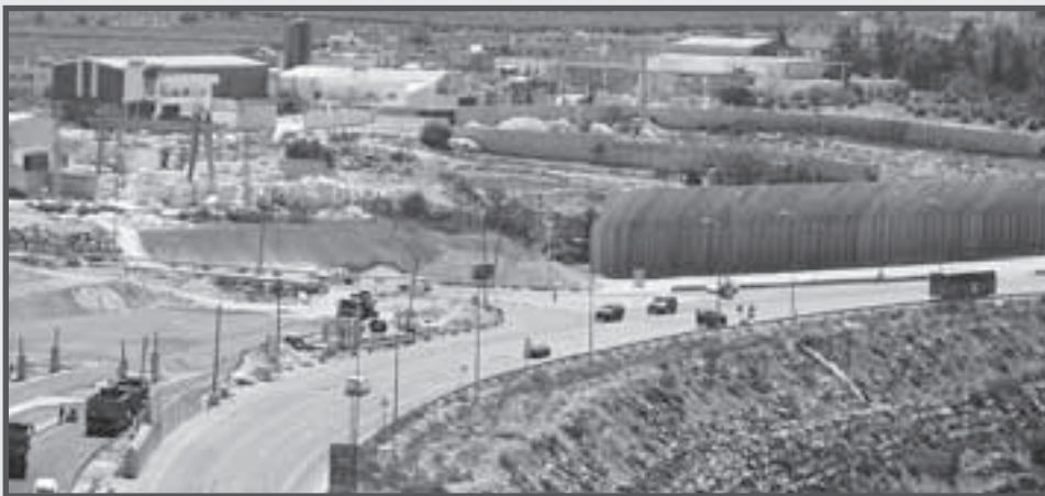
... Anfang Juli 2006 ...