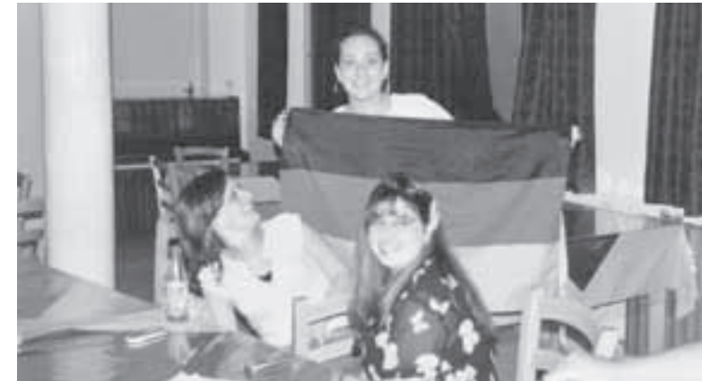
Die deutsche Nationalmannschaft hat viele Fans.

Als am 12. Juli die ersten Bomben auf Beirut fielen, war das unser letzter Tag