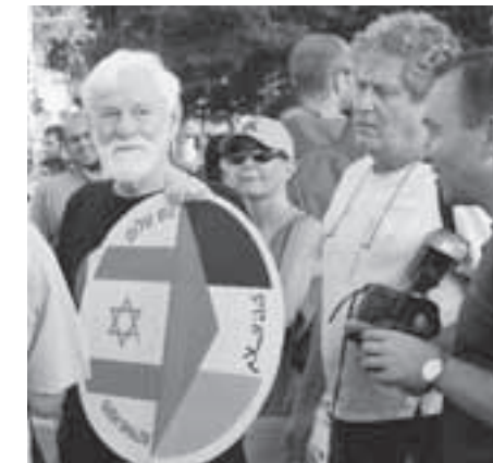
Der unermüdliche Friedensaktivist Uri Avnery auf einer Friedensdemonstration in Tel Aviv.