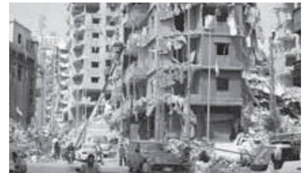
Ruine in Südbeirut.