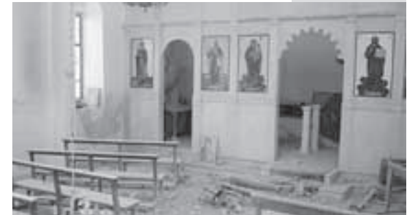
Eine zerstörte Kirche im Südlibanon.

In Haifa schlug eine Bombe mitten im historischen Stadtzentrum, der so genannten Templerkolonie unweit des Hafens ein. Das Haus, das erst vor kurzem unter Denkmalschutz gestellt worden ist und mit Mitteln des Deutschen Städtetages liebevoll rekonstruiert wurde, wurde fast vollkommen zerstört. Es wurde 1890 von dem Seifenfabrikanten Struve gebaut und befand sich bis 1939 im Besitz der Familie.